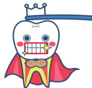
千葉美歯健口伯爵君